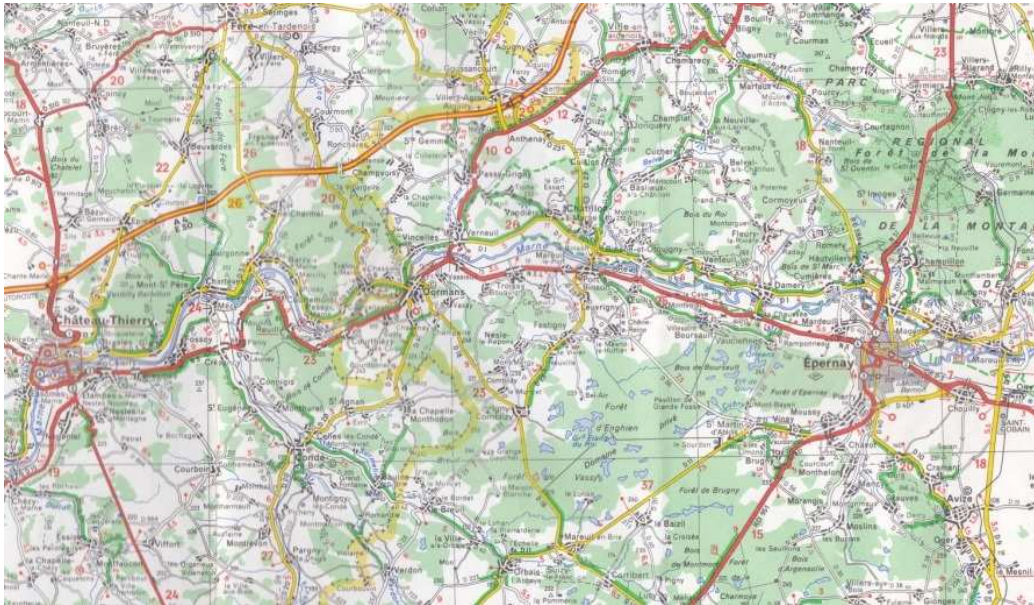
La vallée de la Marne

De nombreux actes de mariage ont été relevés ; les voituriers du Morvan ont fait souche en Champagne et leurs noms de famille y sont aujourd'hui bien présents.